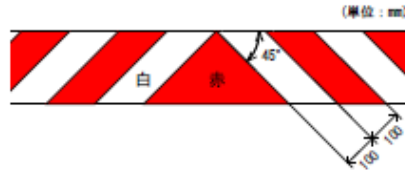
図-1 道路維持作業用自動車バンパー用縞模様